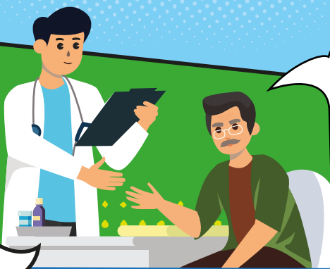
Urine color chart to assess hydration

SALAMAT, DOC JUAN. I-MONITOR NA NAKU KANUNAY AKONG PAG-INOM OG TUBIG. PIRME GYUD NAKU MALIMTAN ANG PAG-INOM OG TUBIG HILABI NA KON DAGHAN KONG GIBUHAAT.